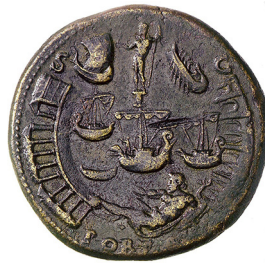
Abb. 14: Sesterz des Nero mit Darstellung des von Claudius errichteten Seehafens Portus (Rs.) Rom, 64/65 n. Chr.

Ikonographische Fragen standen im Zentrum des Vortrags über „Kaiserzeitliche Münzen mit Schiffsmotiven“ von PD Dr. Thomas Schmidts (Mainz). Neben den eindrucksvollen Schiffswracks und -modellen besitzt das Museum für Antike Schifffahrt des Römisch-Germanischen Zentralmuseums in Mainz eine der größten Sammlungen von Münzen mit Schiffsdarstellungen, die in der Datenbank NAVIS III < http://www.rgzm.de/navis3/home/frames.htm > zugänglich sind und den Ausgangspunkt für weitergehende numismatische Forschungen zu dieser Thematik bieten. Handels- und Kriegsschiffe im Münzbild lassen sich aufgrund der oftmals hohen Detailgenauigkeit identifizieren und mit dem archäologisch überlieferten Befund (mit erhaltenen Wracks oder mit Reliefs wie auf der Trajanssäule)