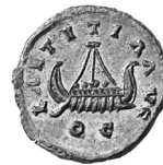
Abb. 16: Aes-Quinar des Allectus mit Darstellung eines Kriegsschiffes (Rs.) Londinium, 294 n. Chr.

abgleichen. Dies bildet die Grundlage für Schmidts' Systematisierung der Prägungen und ihrer inhaltlichen Aussagen in den verschiedenen Phasen der römischen Kaiserzeit. Feste Bindungen zwischen Thematik und Nominal-/Metallwert lassen sich dabei nicht nachweisen. Während noch im 1. Jh. n. Chr. eine wirtschaftliche Thematik durch die Darstellung von Handelsschiffen überwog (die Reihe der kaiserzeitlichen Prägungen begann z. B. unter Nero mit dem bekannten Motiv des Hafens von Ostia mit zahlreichen Schiffen im Hafenbecken (Abb. 14), stieg die Präsenz der Kriegsschiffe im Münzbild im 2. Jh. an (Abb. 15–16), da nun zunächst vermehrt Kaiserreisen, schließlich konkrete Truppenbewegungen thematisiert wurden; auch ankerten im Hafen von Ostia auf den Münzen des Commodus nun zusätzlich Kriegsschiffe. Die severische Zeit bot beide Motive, unter den Soldatenkaisern dominierte erwartungsgemäß die Welt der Kriegsschiffe. Ab constantinischer Zeit wurde das Thema „Schiff“ dann nur noch ein chiffriertes Begleitmotiv des ganz im Zentrum der Münzbilder stehenden Kaisers.