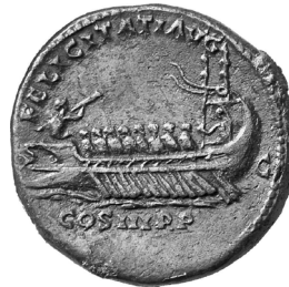
Abb. 15: Sesterz des Hadrian mit Darstellung eines Kriegsschiffes mit Triton im Bug (Rs.) Rom, 125/128 n. Chr.