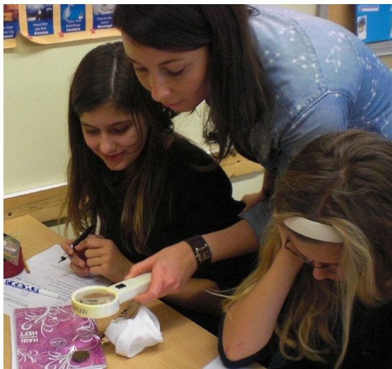
Abb. 17–18: Rostocker Schulprojekt