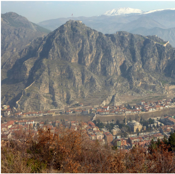
Abb. 12: Stadtansicht von Amaseia/Amasya