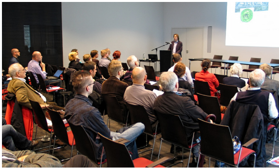
Abb. 1-2: Teilnehmer/innen des 9. Tages der Antiken Numismatik 2014

um für Kunst und Kultur / Westfälisches Landesmuseum verschiedenste numismatische Themenbereiche der Antike, die von naturwissenschaftlichen Methoden über Möglichkeiten ikonographischer Materialauswertung oder klassisch numismatischer Techniken der Fundnumismatik und Hortfundanalyse bis hin zu laufenden numismatischen Aktivitäten reichten und damit ganz unterschiedliche methodische Zugänge und Fragestellungen abdeckten (Abb. 1–2).