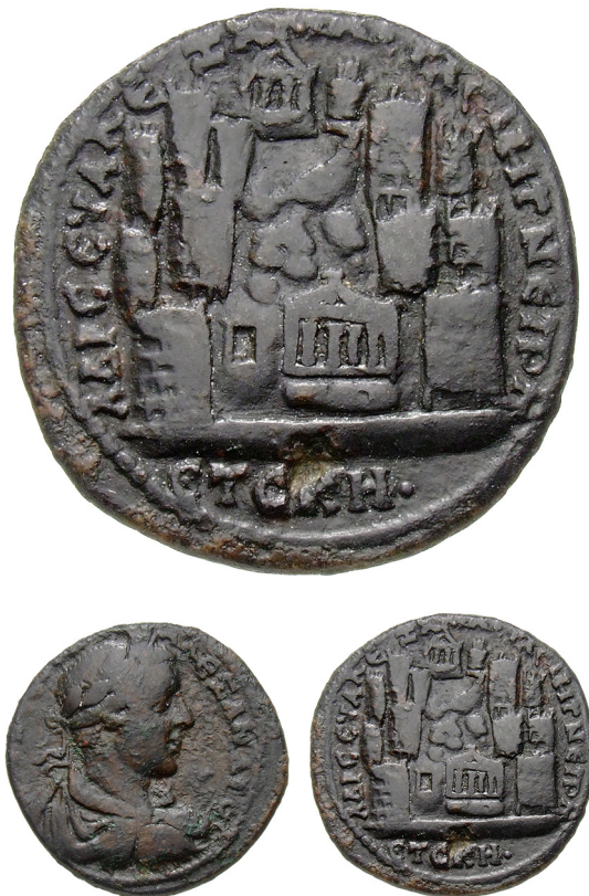
Abb. 13: Münze mit der Stadtansicht von Amaseia, 226/227 n. Chr.: Münzkabinett Berlin, 18216650, Maßstab 1 : 1 und Vergrößerung der Rs. in 2 : 1

Maße er von einem antiken Betrachter wahrgenommen wurde, muss in vielen Fällen selbstredend offenbleiben.