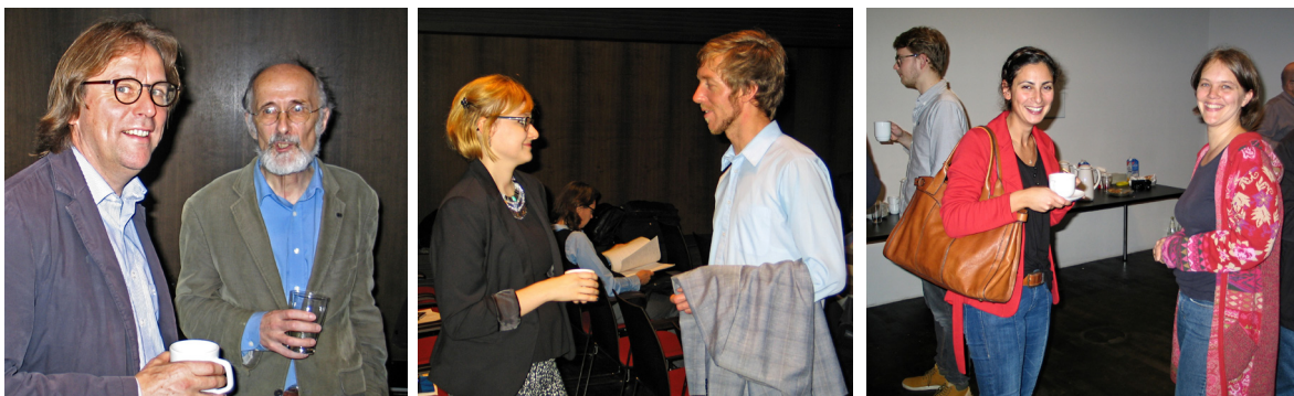
Abb. 4–6 und 8–10: Gespräche und Diskussionen während der Kaffeepausen