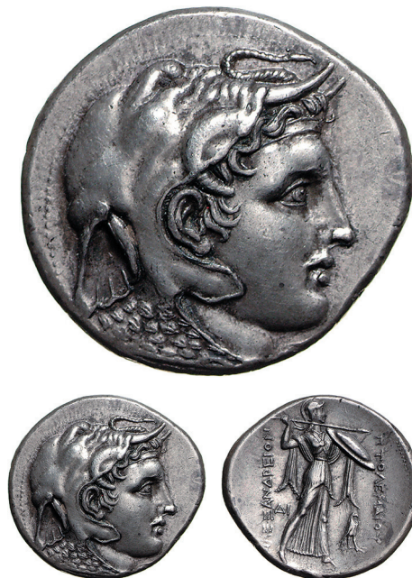
Abb. 11: Alexanderbildnis Ptolemaios' I. (Vs.): Münzkabinett Berlin, 18203059, Maßstab 1 : 1 und Vergrößerung der Vs. in 2 : 1

Makedonenkönig selbst eingeführten Alexanderbildes entwickelten sich dynastisch unterschiedliche Prägungen, die jeweils eigene Antworten auf die politischen und wirtschaftlichen Anforderungen der Zeit fanden. In dem Nebeneinander von seleukidischen und ptolemäischen Verhältnissen wurden die gänzlich verschiedenen Rahmenbedingungen (Zugriff auf Metallressourcen, etablierte oder fehlende regionale Prägetraditionen etc.) deutlich, die ihren Einfluss auf die unterschiedlichen Entwicklungen ausübten. Konnten sich die