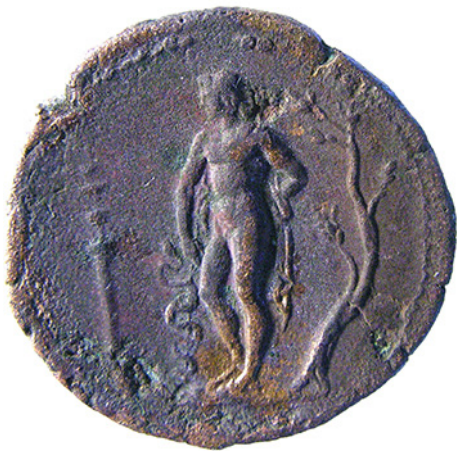
Abb. 3: Medaillon des Marc Aurel mit Darstellung des jugendlichen Aesculap (Rs., Maßstab 2 : 1)

Darstellung und Funktion von Salus (Heilung) und Spes (Hoffnung), die beide ihren Ursprung im 1. Jh. hatten, vom Regierungsantritt Trajans (98–117) bis zum Tod des Commodus (180–192). Ausgangspunkt bei Salus, einem der wichtigsten Themen auf reichsrömischen Prägungen des 2. Jhs., war die Salus Augusti, also das Wohlergehen des Kaisers im Sinne von Gesundheit oder auf Reisen. Eine erweiterte Bedeutung lag bei der Salus Publica, also des Gemeinwesens, und der Salus Generis Humani, also des Menschengeschlechts, vor, wenn sie – in Anbetracht z. B. der Krankheiten Hadrians (117–138) oder unter Antoninus Pius (138–161) und dessen Nachfolgern – im Kontext von Nachfolgeregelungen und somit der Stabilität des Reiches stand. Wie ein Exkurs zeigte, bezogen sich Darstellungen des Aesculap auf Medaillons Hadrians, des Antoninus Pius und Marc Aurels (Abb. 3) stets auf Krankheiten der Kaiser. Spes-Prägungen waren seltener, wobei es auch nur die Spes Publica, ebenfalls im Zusammenhang mit der Kaisernachfolge stehend, nicht die Spes Augusti gab. Dennoch fragte Mittag auch hier nach Hinweisen auf die persönliche Vorstellungswelt der Kaiser und analysierte insbesondere Medaillons des Antoninus Pius, auf denen etwa die Darstellung der Mater Magna dessen Hingezogenheit zu diesem Mysterienkult dokumentiert.